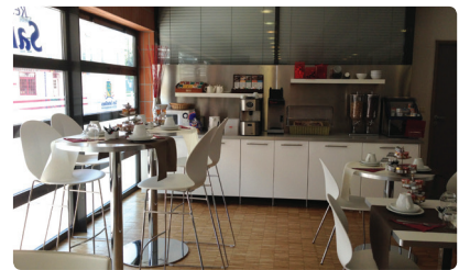
Sala de desayuno