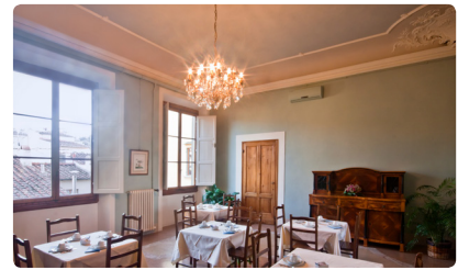
Salón de desayuno